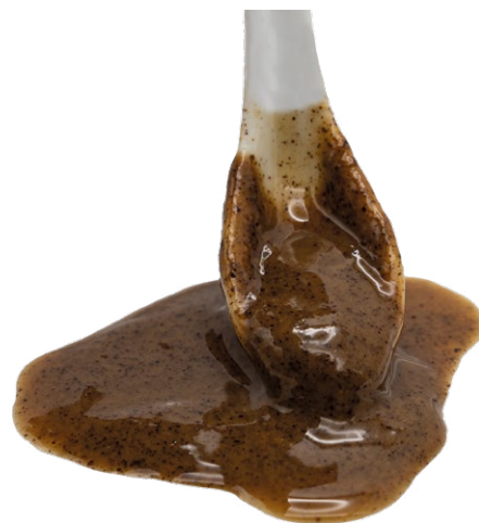
Pasta de Avellana ecológico