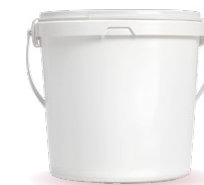
Cubos plástico 5-10-22 kg.

Composición: Almendra tostada (63%), miel (20%) y azúcar.