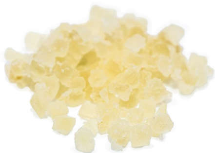
Calabazate Blanco por separado o mezclado