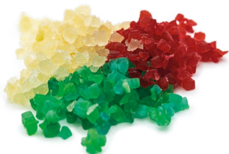
Calabazate confitada: roja, verde, blanca (Escurreda o Glaseada)