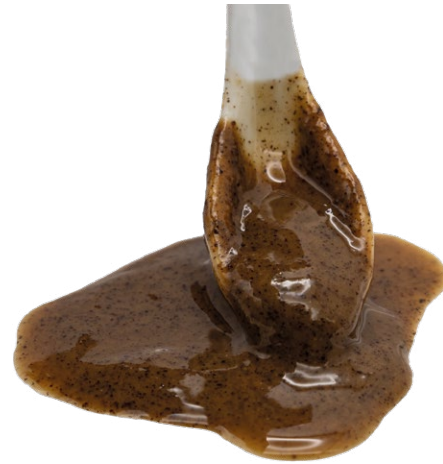
Pasta de Avellana tostada 100% Avellana tostada