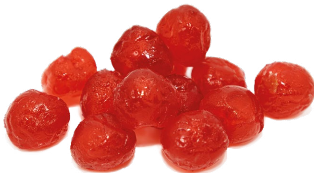
Cerezas Confitadas Rojas, Verdes (Escurreda o Glaseada)