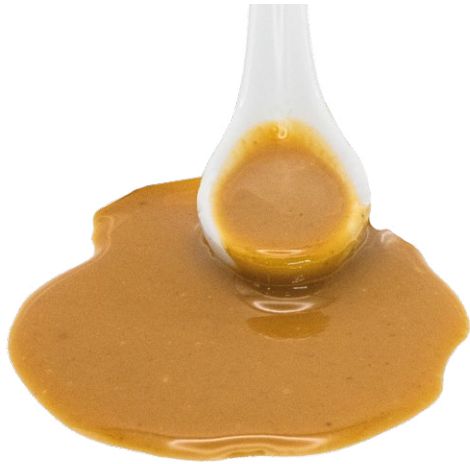
Pasta de Almendra Tostada 100% Almendra tostada