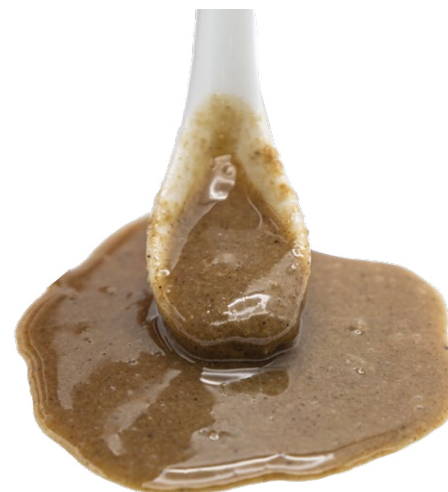
Tahín Integral ecológico (Pasta)