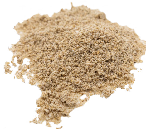
Granito de Sésamo Tostados ecológica