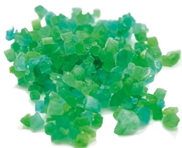
Calabazate Verde por separado o mezclado