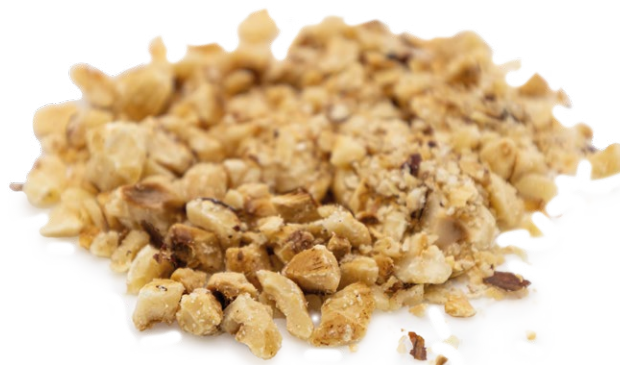
Granito de Avellana Tostada