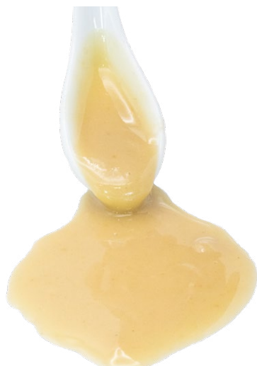
Pasta de Almendra cruda con piel ecológico