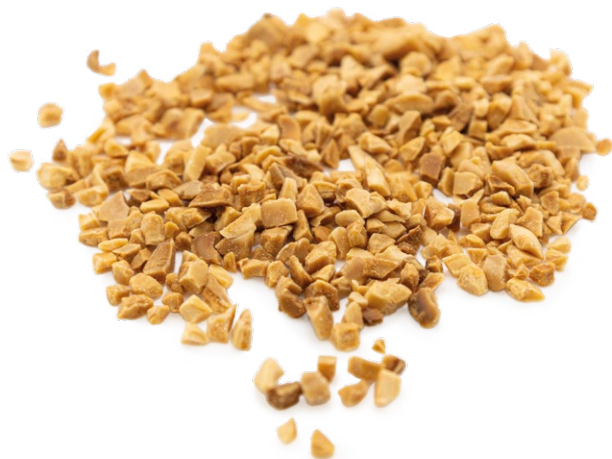
Granito de Almendra Comuna Tostada