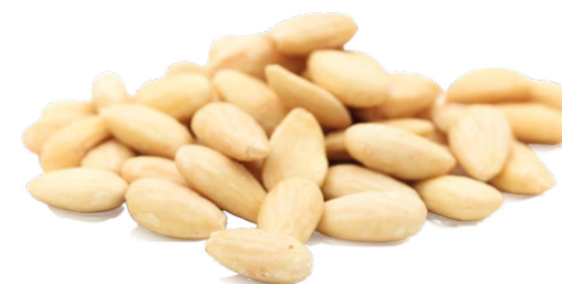
Almendra Marcona repelada tostada