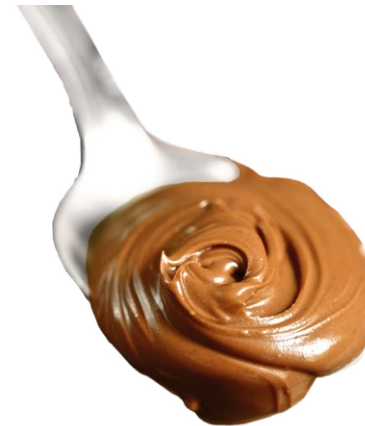
Praliné de Almendra