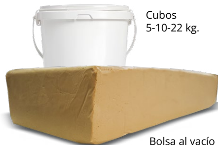
Cubos 5-10-22 kg.

Composición: Almendra tostada (58%), miel (23%), azúcar y albúmina de huevo.