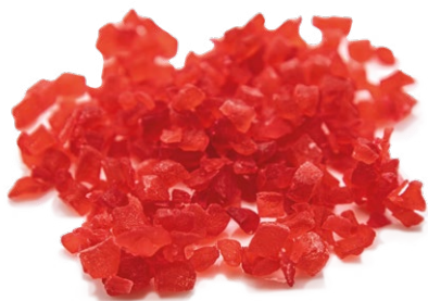
Calabazate Rojo por separado o mezclado