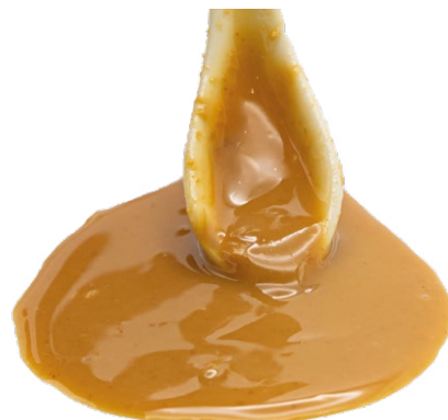
Pasta de Cacahuete tostado ecológico