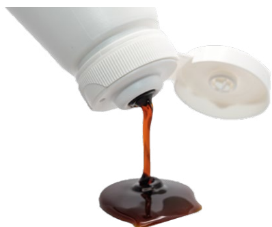
Caramelo líquido (80%)