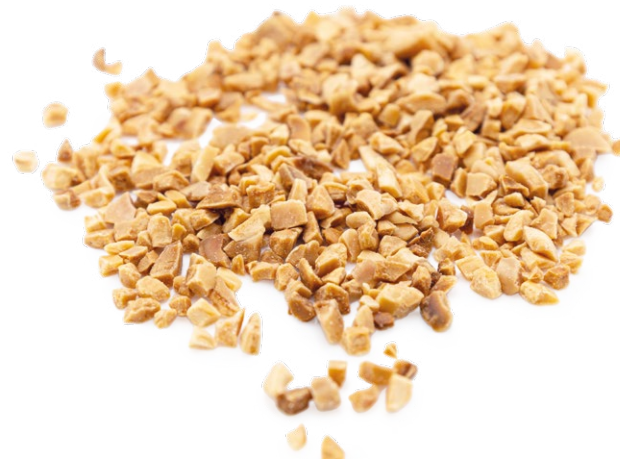
Crocanti de Almendra