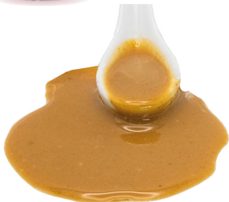
Pasta de Almendra Tostada ecológico