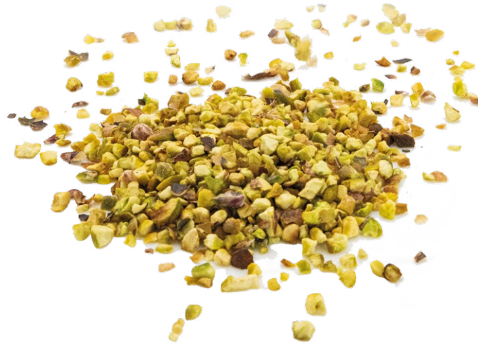
Granito de Pistacho ecológica