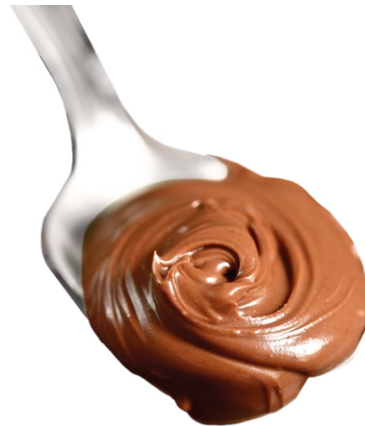
Praliné de Avellana