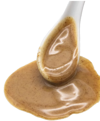
Pasta de Cacahuete Tostado 100% Cacahuete tostada