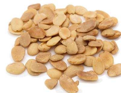
Almendra Medias Marcona repelada tostada