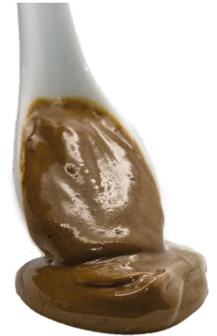
Pasta de Pistacho Tostado 100% Pistacho tostado