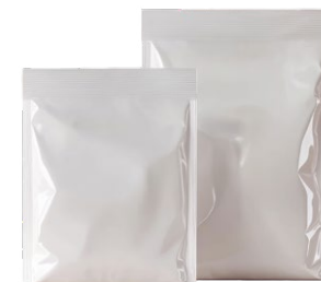
Bolsa al vacío: 2 y 5 kg.