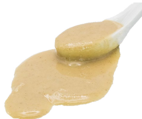
Tahín Decortinado (Blanco) ecológico (Pasta)