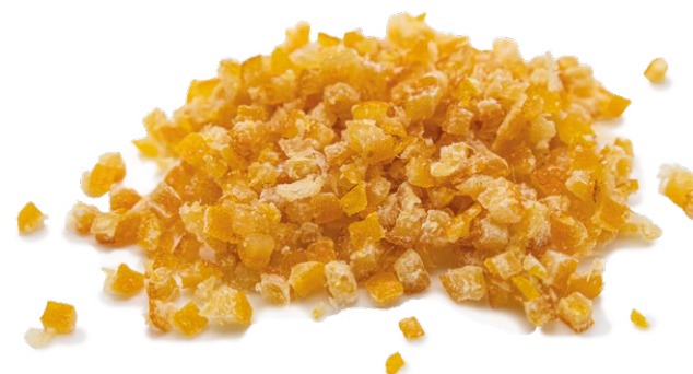
Tutti-frutti: piel de naranja